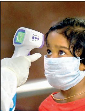
হাওড়া স্টেশনে পৌঁছানোর পর পরীক্ষা।

তাছাড়া কোনও করোনা রোগীর সংসর্গে আসা ব্যক্তিদের কোনও উপসর্গ না-থাকলেও সংসর্গে আসার পাঁচদিনের মধ্যে প্রথমবার এবং দশম দিনে দ্বিতীয়বার করোনা-পরীক্ষা করতে হবে বলে জানিয়েছে আইসিএমআর। এতদিন চোক্ষোমত দিনে দ্বিতীয়বার পরীক্ষা করা হচ্ছিল। স্বাস্থ্যমন্ত্রকের এক অফিসার জানিয়েছেন, দেশে করোনা সংক্রমিতের সংখ্যা দ্রুত বাড়তে থাকায় নতুন নির্দেশিকা দেওয়া হয়েছে। এর উদ্দেশ্য সংক্রমণের গতি কমানো। সরকারি পরিসংখ্যান অনুযায়ী, এখন দিনে ৫ হাজারের বেশি মানুষ সংক্রমিত হচ্ছেন।